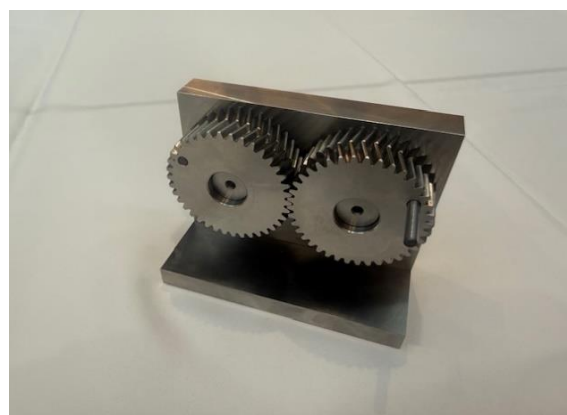
ダブルヘリカルギヤ(やまば歯車)