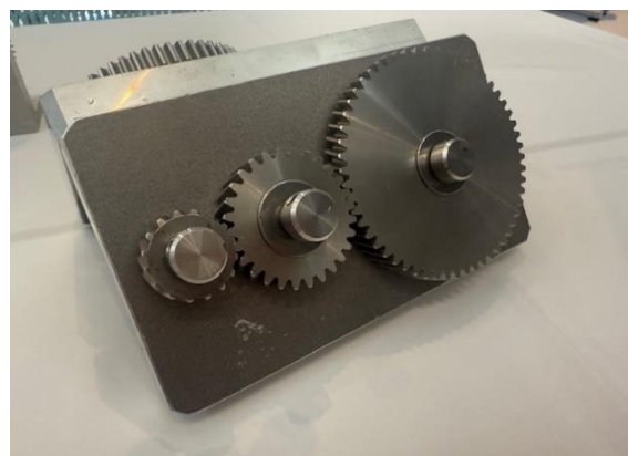
ヘリカルギヤ(はすば歯車)