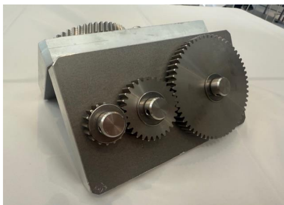
スパーギヤ(平歯車)